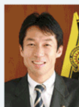
秋山浩保氏 (柏市長)