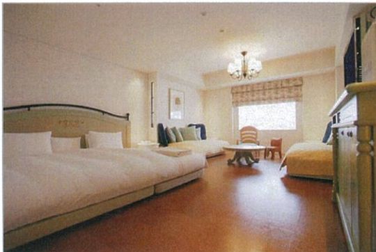
0歳~3歳向け「ベビーズスイート」“オレンジ”

・お子様連れファミリーのためのエグゼクティブフロア専用サービスとして、お子様の知育体験プログラムを提供するスペース。