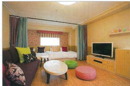
4歳~6歳向け「キディスイート」“ミルフィユ”